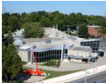
Burlington Art Centre : Blimp Pics