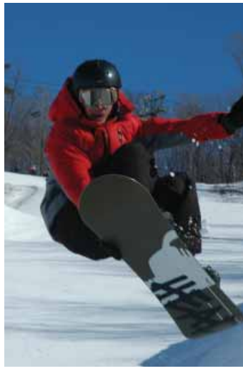
Planche à neige à Glen Eden