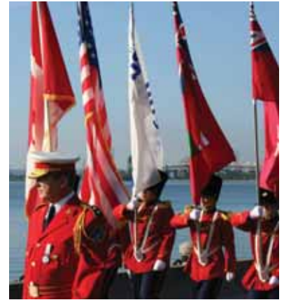
Teen Tour Band de Burlington