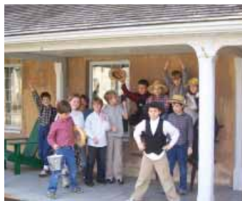
Ireland House d'Oakridge Farm