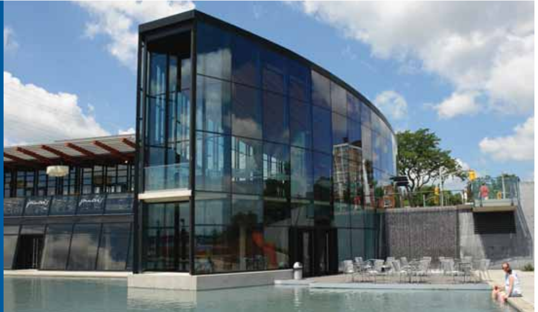
Discovery Landing : David Whale

Burlington profite généralement d'un climat continental, avec des étés chauds et humides et des hivers froids et secs. Cela s'explique par la proximité du lac Ontario, qui permet de réduire l'incidence de températures extrêmes. Les températures les plus hautes vont de 27 °C en juillet à 0 °C en janvier. Burlington reçoit en moyenne 71 cm (28 po) de pluie et 130 cm (51 po) de neige annuellement.