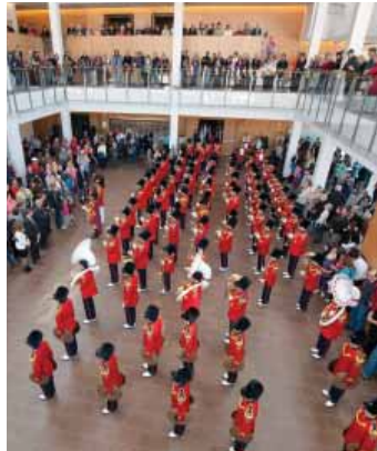
Teen Tour Band au Burlington Performing Arts Centre