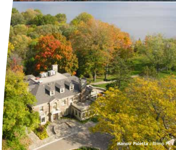
Manoir Paletta : Blimp Pics