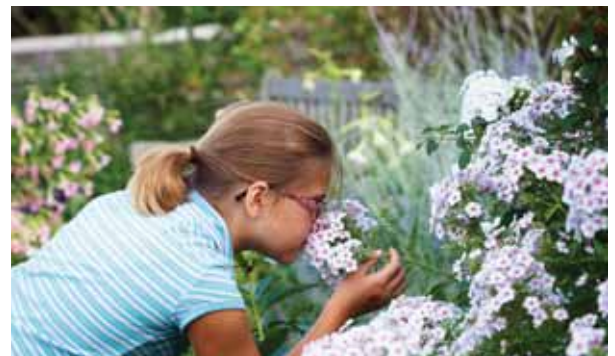
Jardins botaniques royaux - Daniel Banko

Fort de sa passion pour les arts, Burlington abrite un tout nouveau centre des arts d'interprétation, des musées d'histoire et une galerie d'art de première qualité. Les familles peuvent se divertir à bas prix en suivant une route panoramique et en s'arrêtant à l'une des nombreuses attractions touristiques locales, telles que les jardins botaniques royaux, le secteur riverain, le Centre d'art, les musées, le parc provincial Bronte Creek et les aires de conservation Halton. Grâce à ses nombreuses attractions amusantes, pittoresques et abordables, Burlington est la destination idéale pour tous, en famille ou en solo.