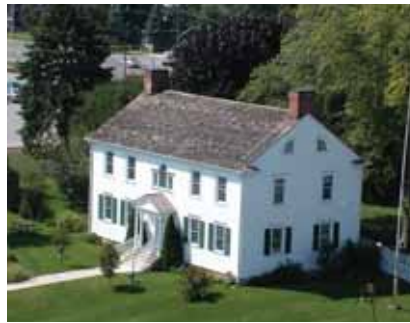
Musée Joseph Brant

Cette période agraire de notre histoire a été marquée par des activités aujourd'hui disparues. Les conserveries commerciales, l'entreposage de glace et les usines de fabrication de paniers ont été remplacés par des entreprises modernes et des industries de haute technologie, ayant amené avec elles bon nombre de nouveaux résidents. Depuis la visite de LaSalle il y a plus de 300 ans, Burlington est devenue une communauté urbaine prospère, offrant une excellente qualité de vie.