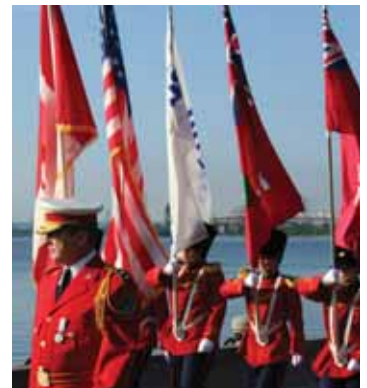
De Burlington Teen Tour Band