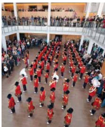
Burlington Teen Tour Band in The Burlington Performing Arts Centre