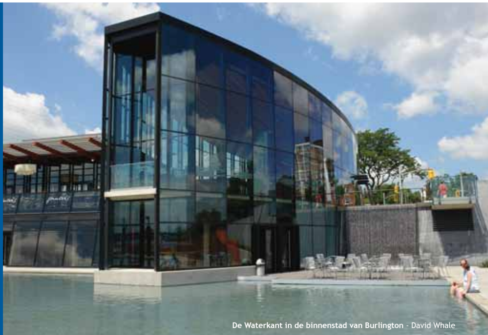
De Waterkant in de binnenstad van Burlington - David Whale

Het klimaat van Burlington is over het algemeen continentaal met warme, benauwde zomers en koude, droge winters. Het klimaat is gematigd door de nabijheid van het Meer van Ontario; de extreme temperaturen worden hierdoor tegengehouden. De maandtemperaturen variëren van 27 °C in juli (hoogst) tot 0 °C in januari. Er valt ongeveer 28" regen en 51" sneeuw.