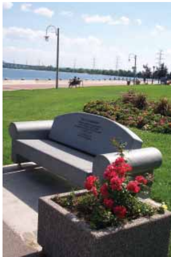
“Louise” Landschap meubilair geschonken door Apeldoorn, Spencer Smith Park