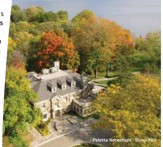
Paletta Herenhuis - Blimp Pics