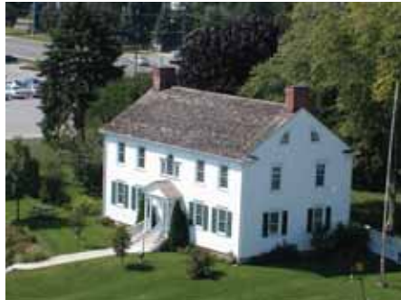
Joseph Brant Museum - Blimp Pics

De agrarische periode van onze geschiedenis had activiteiten die nu niet meer bestaan. Commerciële conservenfabrieken, het oogsten van ijs en mandfabrieken zijn vervangen door moderne concerns en high-tech bedrijven, waardoor een grote toevloed van nieuwe bewoners ontstond. Vanaf het bezoek van LaSalle naar deze streek meer dan 300 jaar geleden, is Burlington gegroeid tot een enorm succesvol stadsgebied met een aantrekkelijke levenskwaliteit.