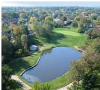
Tyandaga Gemeentelijke Golf links