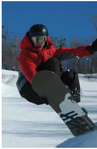
Snowboard na Glen Eden