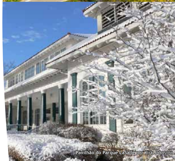
Pavilhão do Parque LaSalle por Kirk Johnston