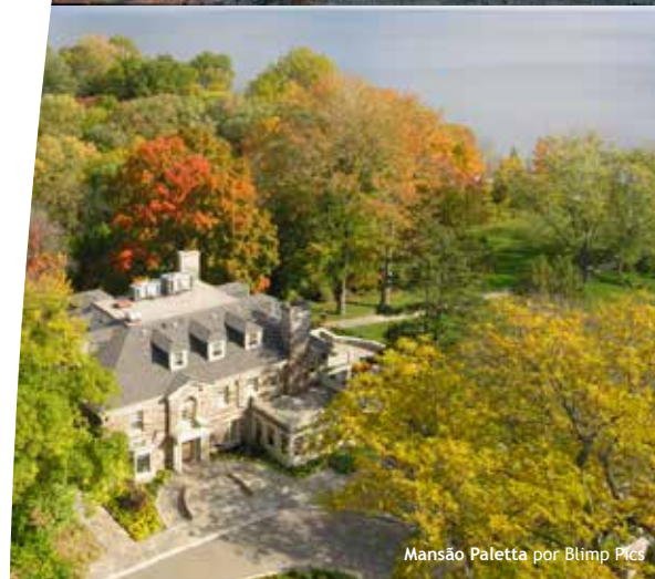
Mansão Paletta