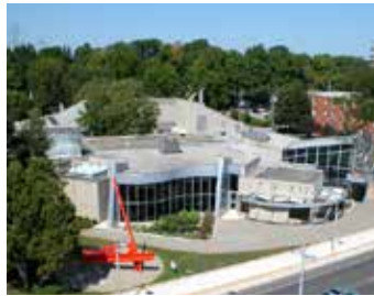
Galeria de Arte de Burlington - Blimp Pics