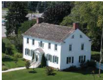
Museu Joseph Brant

O período agrário de nossa história foi marcado por atividades que já não existem mais. Fábricas de conservas comerciais, colheita de gelo e fábricas de cestos foram substituídas por empresas modernas e indústrias de tecnologia avançada, que atraíram novos moradores. Desde a visita de LaSalle a esta região há 300 anos, Burlington cresceu e se tornou uma região urbana muito bem-sucedida com uma qualidade de vida muito atrativa.