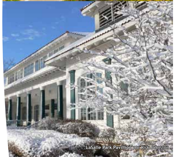
LaSalle Park Pavillion por Kirk Johnston