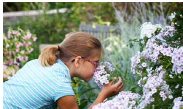
Royal Botanical Gardens por Daniel Banko

Con tanta diversión, y atractivos pintorescos y asequibles, Burlington ofrece satisfacción garantizada tanto para las familias como para cada individuo.