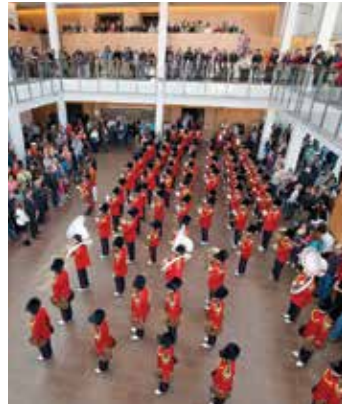
Burlington Teen Tour Band en The Burlington Performing Arts Centre