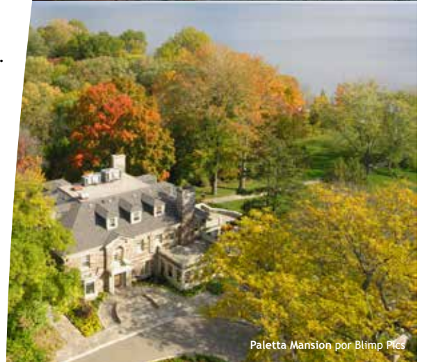
Paletta Mansion