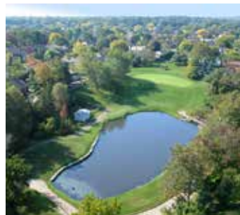
Campo de golf municipal de Tyandaga