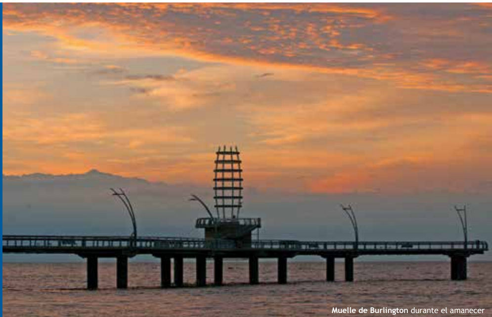
Muelle de Burlington durante el amanecer

El clima de Burlington es, por lo general, continental, con veranos cálidos y húmedos e inviernos fríos y secos. Esto se ve moderado por la proximidad con el lago Ontario, el cual tiende a reducir las temperaturas extremas. Las temperaturas altas mensuales varían de 27 grados centígrados en julio a 0 grados centígrados en enero. El promedio de precipitación anual es 711 mm (28 pulg.) de lluvia y 1.3 metros (51 pulg.) de nieve.