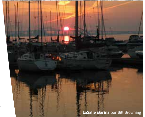
LaSalle Marina por Bill Browning