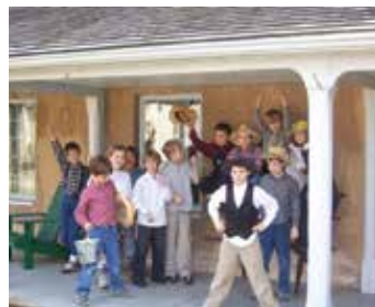
Casa irlandesa en la granja Oakridge